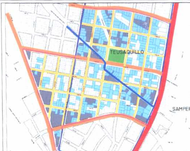
Inmuebles de Interés Cultural - MORFOLOGÍA EN PLANTA