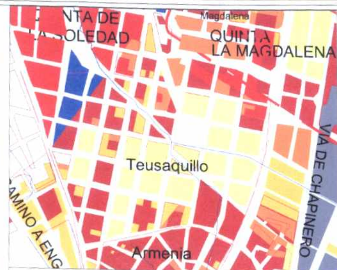
CRECIMIENTO HISTÓRICO - CRONOLOGÍA